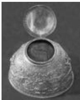
Sfântul cap al Cuviosului Antim, care se păstrează și se cinstește în paraclisul Chilieii Intrării Maicii Domnului în Biserică a Obștii Teofililor.