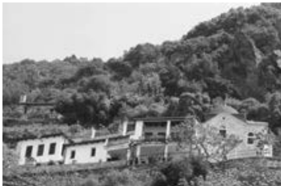
Chilia Intrării Maicii Domnului în Biserică a Obștii Teofililor, Schitul Sfânta Ana, Muntele Athos.