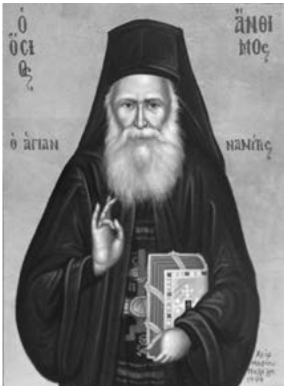
Icoană grecească pictată de Marios Pelelis.