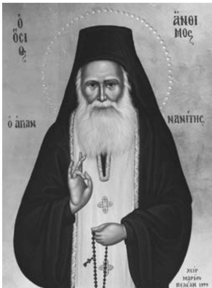
Icoană zugrăvită de Marios Pelelis