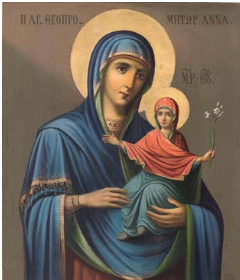
Icoana Sfintei Ana pictată în anul 1933 de către Obștea Teofililor în stil iconografic neoclasic athonit.