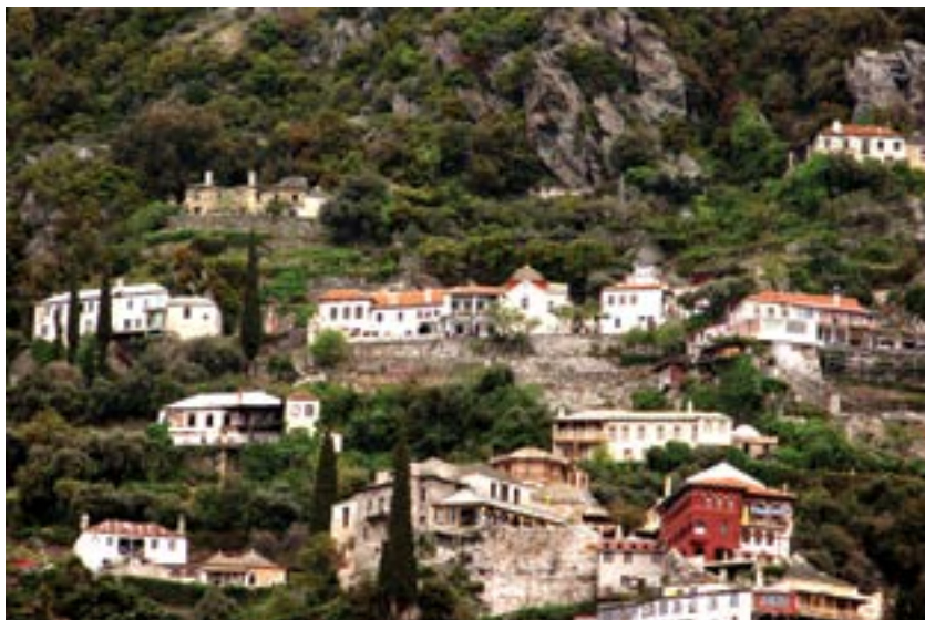
Schitul Sfânta Ana, cel mai vechi și mai important schit din Muntele Athos. Câteva chilii din jurul kiriakonului , detaliu.