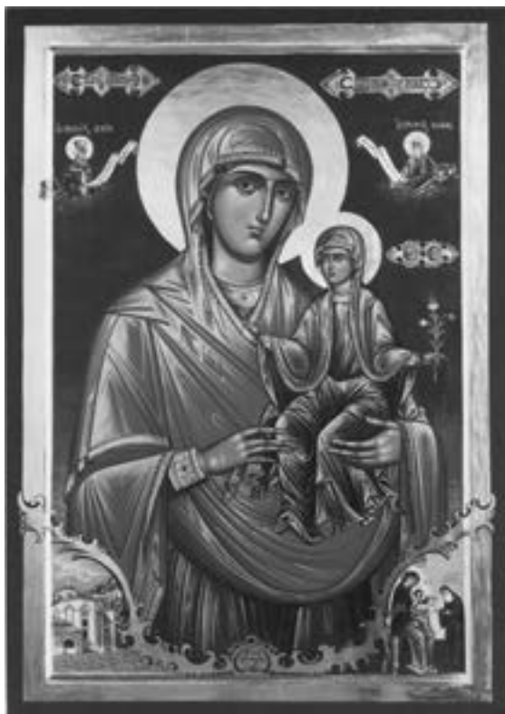
Icoană contemporană a Sfintei Ana cu Fecioara Maria pictată de Obștea Teofililor de la Schitul Sfânta Ana, Sfântul Munte Athos